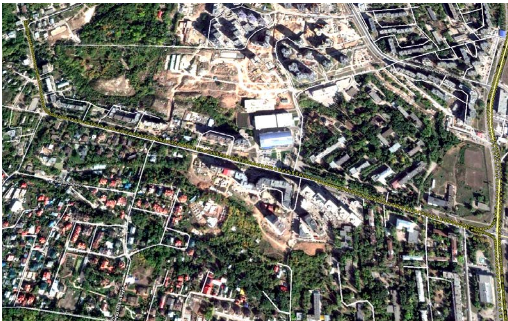
Рис. 5. Фрагмент маршрута движения мобильной станции, нанесённый на геопривязанный снимок города Самары (участок по ул. Советской Армии от ул. Ново-Садовой к р. Волге, длина участка – 1790 м)