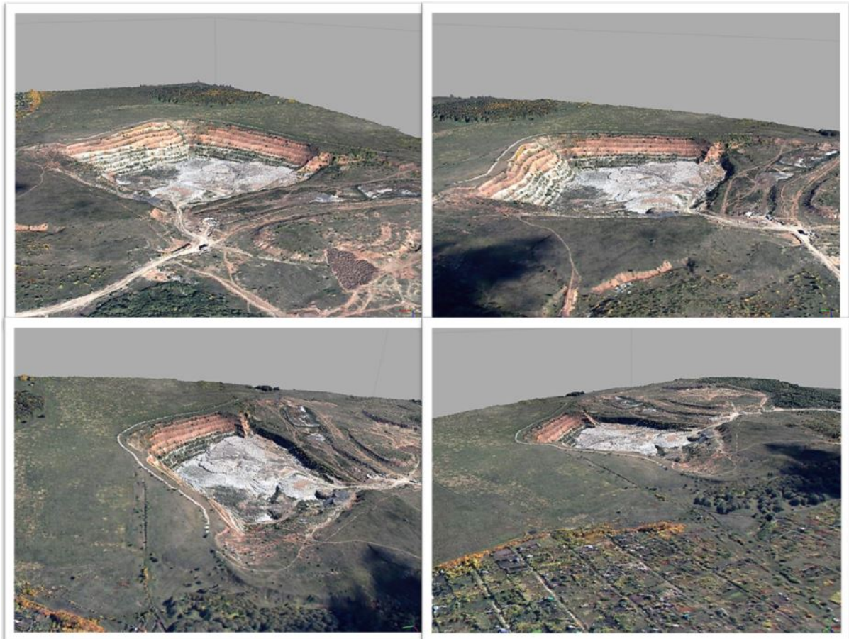
Рис. 3. Визуализация трёхмерной модели местности, построенной по данным авиационной съёмки (Водинский карьер, Волжский район, Самарская область)

Имеющееся в распоряжении АО «РКЦ «Прогресс» навигационное оборудование и соответствующее программное обеспечение для обработки навигационной информации дали возможность разработать инновационную технологию получения высокоточных сечений рельефа местности, соответствующих дорожной сети на территории полигона и существенно повышающих точность оценки создаваемых по результатам космической стереосъёмки ЦМР. В ходе проведённых работ была разработана и экспериментально подтверждена методика получения таких профилей с использованием технологии SPAN (Synchronized Position, Attitude and Navigation), основой которой является жёстко связанный алгоритм комбинирования инерциальных и спутниковых измерений, который обеспечивает высокую точность решений даже при временном отсутствии спутниковых сигналов. При этом показано, что наличие