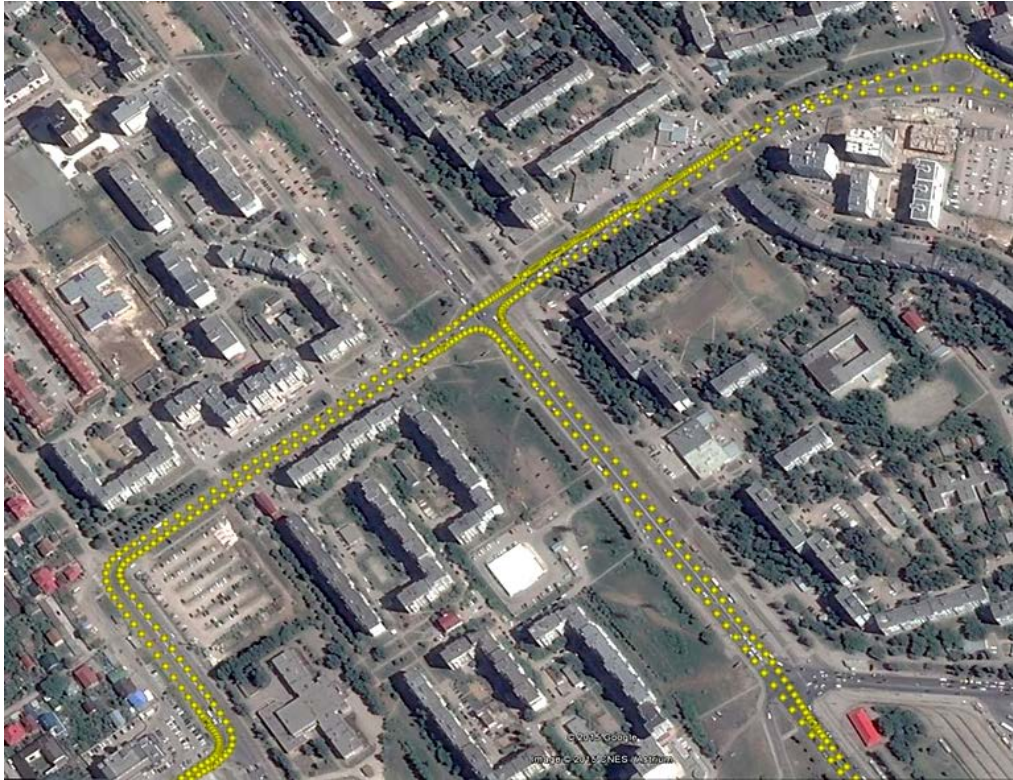
Рис. 4. Детальный фрагмент маршрута движения мобильной станции, нанесённый на геопривязанный снимок города Самары (район пересечения улиц Демократическая и Георгия Димитрова)