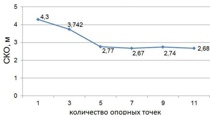
Рис. 2. Зависимость точности создаваемой ЦМР от количества используемых опорных точек

Использование этих технологий позволяет получить данные о высоте каждой точки заданной территории за достаточно короткий срок. Однако применимость их в реальных условиях достаточно ограничена: с одной стороны – высокой стоимостью проведения работ, а с другой стороны – организационно-техническими проблемами, связанными с получением разрешительных документов, особенно в случае лидарной съёмки, где из-за наличия достаточно мощного лазерного излучения необходимо дополнительно обеспечивать выполнение требований экологической безопасности.