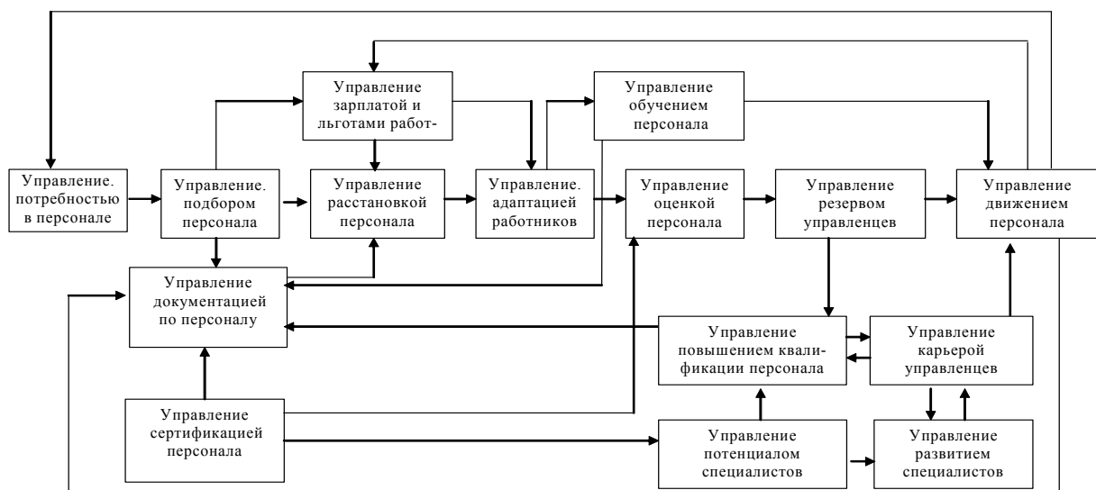
Рис. 4. Системный граф менеджмента персонала

цедур управления (ФПУ), превращающих входную информацию в выходную. На рис. 3 представлена многоуровневая функциональная структура системы управления организацией.