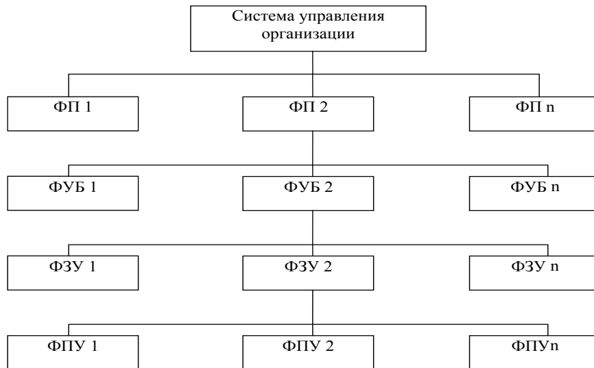
Рис. 3. Функциональная структура системы управления организации