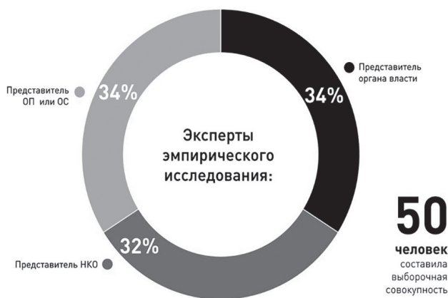
Рис. 1. Распределение экспертов эмпирического исследования по группам опрошенных, в % (N=50) Fig. 1. Grouping of empiric study experts in pollees, as % (N=50)

В качестве эмпирического объекта исследования выступили ключевые агенты цифровизации гражданского общества в Самарской области – эксперты в области цифровых технологий, являющиеся представителями органов власти разного уровня и госбюджетных организаций (17 экспертов), представителями НКО (16 экспертов) и представителями общественных советов при региональных органах исполнительной власти, общественных палат и общественных советов муниципальных образований Самарской области (17 экспертов) (рис. 1).