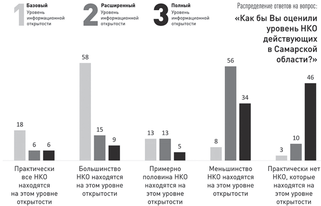
Рис. 5. Распределение ответов на вопрос: «Как бы Вы оценили уровень НКО, действующих в Самарской области?» (в %, по всему массиву опрошенных)

Один из участников исследования дал развернутое пояснение, почему одни организации размещают о себе минимально необходимую информацию («базовый» уровень), а другие – обеспечивают максимальную прозрачность ин-