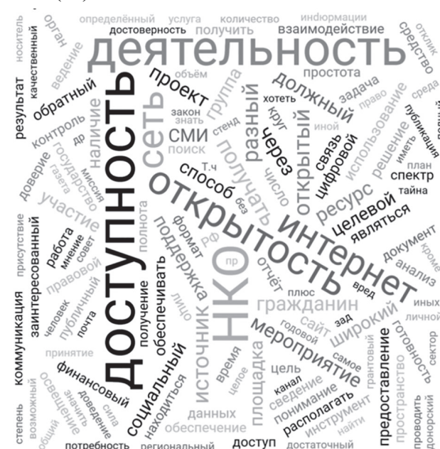
Рис. 2. «Облако тегов» содержания понятия «информационная открытость», по мнению опрошенных экспертов

ко тегов из лемматизированных слов экспертов относительно понятия «информационная открытость» (рис. 2). Использование профессиональной онлайн-программы «Адвего» ( https://advego.com/text/seo/ ) позволил провести семантический анализ суждений экспертов относительно понятия «информационная открытость» (рис. 3 и 4). По итогам семантического анализа была определена частота слов, использованных в суждениях экспертов относительно понятия «информационная открытость». Чаще всего «информационная открытость» характеризовалась словами: информация (40), доступность (20), деятельность (18) и НКО (18).