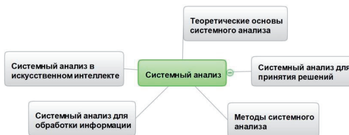
Рисунок 7 – Граф знаний научной специальности «Системный анализ, управление и обработка информации, статистика» по данным YandexGPT

Чтобы обосновать формирование тех или иных обобщений в конкретной ПрО, которые вырабатывают участники ПрО, можно попытаться построить концептуальную модель знаний участника (индивида) и консенсусную модель обобщения знаний в этой ПрО.