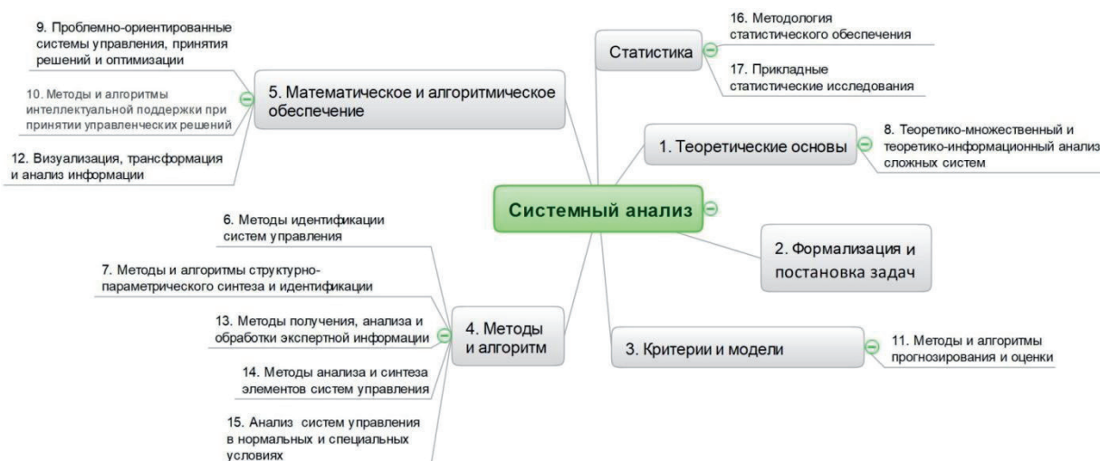
Рисунок 6 – Граф знаний научной специальности «Системный анализ, управление и обработка информации, статистика»

Контекст слов, его понимание и применение при анализе текста с целью получения тех или иных выводов полностью зависит от знаниевой базы индивида, механизма согласия с другими индивидами, с их мнениями и представлениями о той или иной ситуации, факте или теории.