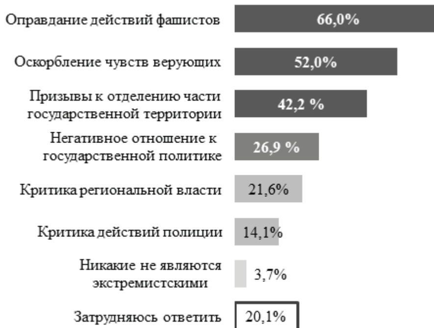
Рисунок 5 – Представления студентов о «запретных» темах для публикации в сети Интернет (N=4815 чел.)