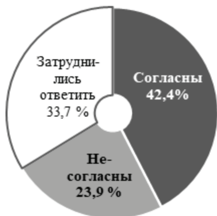
Рисунок 4 – Распределение ответов на вопрос: «Согласны ли Вы с тем, что сопротивление полиции в определенных случаях может быть оправдано?» (N=4815 чел.)

Таким образом, можно констатировать наличие лагун и даже противоречий («общаться с полицией нельзя, но сопротивляться ей можно») в том, что принято называть правовой грамотностью студентов в контексте участия в массовых мероприятиях.