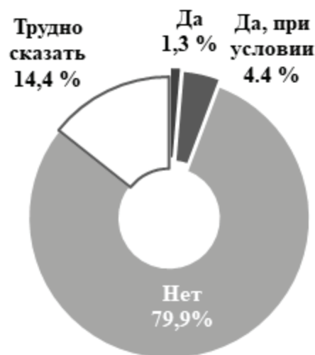
Рисунок 6 – Распределение ответов на вопрос: «Представьте, что Вам предложили за хорошую оплату поддержать в соцсети экстремистскую организацию: ставить лайки на ее странице, делать репосты и размещать в своем аккаунте публикации о ней. Согласились бы Вы на такое сотрудничество?» (N=4815 чел.)

среднего, либо, напротив, с очень высокими доходами. Также среди них больше молодых людей с активной жизненной позицией (состоят в каких-либо формальных и неформальных организациях,