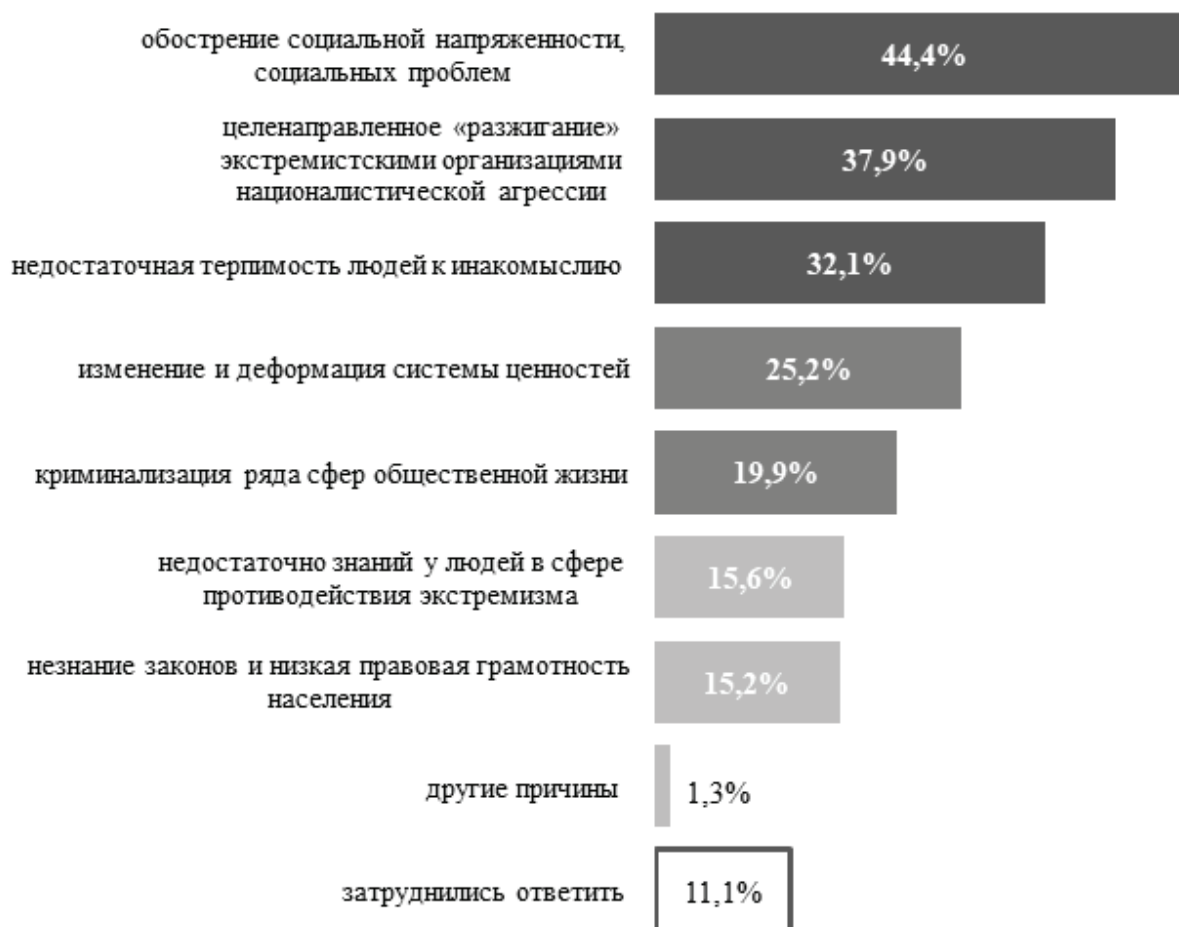
Рисунок 3 – Студенты о причинах экстремизма (N=4815 чел.) Figure 3 – Students about the causes of extremism (N=4815 people)

работы со студентами по вопросам сущности экстремизма и противодействия его проявлениям.