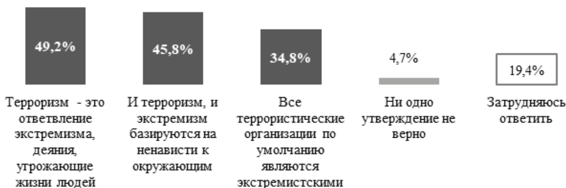
Рисунок 2 – Представления студентов о связи терроризма и экстремизма (N=4815 чел.)