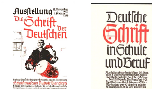
Рисунок 5 – Плакаты выставок «Письмо немцев» (1934 г.) Figure 5 – Posters for the exhibition «Letter from the Germans» (1934)

Волна нацистской «моды на фрактуру» в основном пришлась на 1934 год, отмеченный, в частности, знаковой для Германии подготовкой возвращения отторгнутой и находившейся под управлением Лиги наций Саарской области. Так, бесплатная выставка Die Schrift der Deutschen (Письмо немцев) в Берлине 1933–1934 гг. открыла череду аналогичных пропагандистских перформансов, продолжавшуюся до 1940 года. В 1934–1938 гг. под этой вывеской работала серия передвижных патриотических выставок, название которых стало слоганом, а трансляцию этой идеологемы обеспечивали масштабные «Недели немецкой книги» (рис. 5).