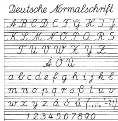
Рисунок 14 – Стандарт «немецкого нормативного письма» (1942 г.)

С сентября 1941 года в школах рейха исключались обучение письму по прежнему стандарту 1935 года и использование шрифта Зюттерлина, где усматривались «нежелательные» теперь элементы фразатуры. Знакомство школьников с печатной фразатурой предполагало лишь навыки чтения в начальных классах ранее изданных книг, приоритетом объявлялось «латинское письмо» (антиква). Новый учебный стандарт вступил в силу с 1942 года, и старшекласники, ранее изучавшие готику, переучивались на антикву. Впрочем, переход на антикву на письме снял проблему диглифии в латинице для начинающих изучать иностранные языки, поскольку написание (графические знаки) стало единообразным с родным языком [Gugel 2006] (рис. 14).