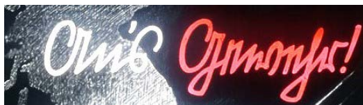
Рисунок 11 – Фрагмент плаката СА Ans Gewehr! ( К оружию! ) курсивом «зюттелин» (начало 1930-х гг.) Figure 11 – Fragment of the SA poster «Ans Gewehr! ( To arms! )» in italics « süttelin » (early 1930-ies)

1939–1941 гг. – период активной территориально-политической экспансии нацистской Германии и реализации курса на завоевание мирового господства, связанного с этим максимального расширения территории рейха. Нацистское руководство идеологически обосновало это обретением Lebensraum (жизненного пространства) для этнических немцев (VdNS 2007, S. 275). Языковая политика нацизма трансформировалась на этапе начала его военной «инвазии» провозглашением «Великогерманской империи ( Großdeutsches Reich )», проявлением теперь уже «внешнего» Kulturkampf , школьной реформой, установкой на германизацию захваченных территорий.