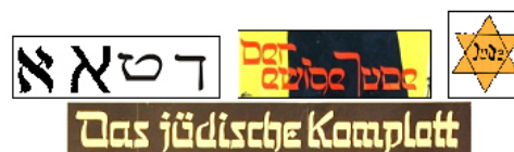
Рисунок 13 – Образцы древнееврейского алфавита и стилизации на антисемитских плакатах и «желтой звезде» Figure 13 – Examples of the Hebrew alphabet and stylization on anti-Semitic posters and the «yellow star»

Инспирируемые «квазисемитские знаки» немецкой графики нередко маркировались желтым цветом, используемым и на «Желтой звезде» («желтый знак», «знак позора»), которую с 1939 года обязаны были носить на одежде все евреи. Наглядные примеры – плакаты крупнейшей антисемитской передвижной выставки Der ewige Jude («Вечный еврей») (1937–1939 гг.) и театрального релиза одноименного пропагандистского фильма, снятого по заказу ведомства Геббельса в 1940 году. Но привязка этого «графического компромата» к шрифту «швабахер» не выдерживала критики, являясь индикатором подготовки нацистами общественного мнения в поддержку «окончательного решения еврейского вопроса» в 1941–1945 гг. в Европе (рис. 13).