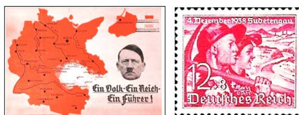
Рисунок 10 – Аннексия Судет: почтовая открытка и марка (1938 г.) Figure 10 – Annexation of the Sudetenland: postcard and stamp (1938)

Примечательно, что присоединение Австрии и Судет к Третьему рейху не сопровождалось постановкой вопроса реформы и «единения» общенемецкой орфографии. Исследователи отмечают как парадокс: основные «<...> немецкоязычные территории Европы (за исключением Швейцарии) так или иначе находились под контролем национал-социалистов, то есть наступило, как казалось, время для проведения орфографической реформы и создания правописания, которое было бы единым для всего немецкого народа. Тем не менее «<...> не было принято никакого орфографического декрета» [Вульф 2003, с. 210].