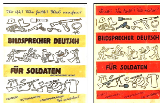
Рисунок 15 – Шрифтовое оформление обложек пособия для рекрутов (1944 г.)