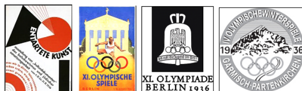
Рисунок 7 – Выставка «Дегенеративное искусство» и Олимпийские игры: плакаты и эмблемы Figure 7 – Exhibition «Degenerate Art» and the Olympic Games: posters and emblems

Намеренным было «компромиссное» использование футуры в нацистских пропагандистских изданиях, на плакатах конца 1930-х гг. в стратегии «новой имиджизации», международного позиционирования гитлеровского режима. Это отразилось в дизайне шрифтового оформления эмблем, постеров, объявлений и печатной продукции для важнейших в политике Третьего рейха акций. Например, для выставок под эгидой Kulturkampf против т. н. «дегенеративного искусства» (1936–1941 гг.), для Всемирной выставки (Брюссель, 1935 г.), на XI летних и IV зимних Олимпийских играх (Берлин, Гармиш-Партенкирхен, 1936 г.). Хотя на игры в Берлине в германскую команду не были допущены евреи, вуалировалось превосходство «белой и арийской рас» – при подготовке были убраны юдофобские лозунги и объявления с «немецким шрифтом» [Beinert 2001]. Впрочем, на эмблеме летних игр – колоколе – надпись Ich rufe die Jugend der Welt! (Я призываю молодежь мира!), за которой мыслилась фигура Гитлера, была выполнена фрактурой, а дайджест летних игр Olympia Zeitung содержал фрактурные титульные вставки в заметках о германских атлетах (рис. 7).