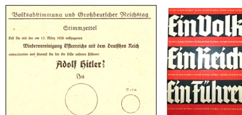
Рисунок 9 – Бланк и брошюра плебисцита по «присоединению» Австрии Figure 9 – Form and brochure of the plebiscite on the «annexation» of Austria

Sudetenland ) со столицей в Райхенберге (бывший чешский Либерец). Это также орнаментировалось фразурой в пропагандистской печати, на плакатах, почтовых знаках [Antigua-Fraktur-Streit] (рис. 10).