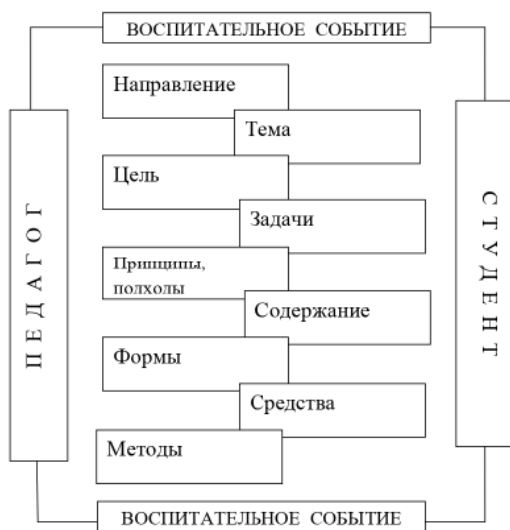
Рис. 1. Организационная структура воспитательного события Fig. 1. Organizational structure of an educational event

Данная модель вполне подходит для проектирования воспитательных событий и может быть предложена в качестве средства событийного проектирования. Модель событийного проектирования (рис. 2) отличается систематичностью (про-