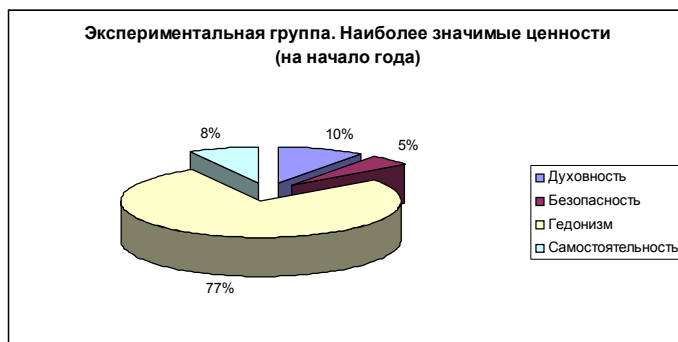
Рис. 1. Экспериментальная группа. Наиболее значимые ценности (на начало года)