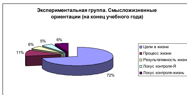
Рис. 4. Экспериментальная группа. Смысложизненные ориентации (на конец учебного года)

После проведения эксперимента результаты экспериментальной группы изменились.