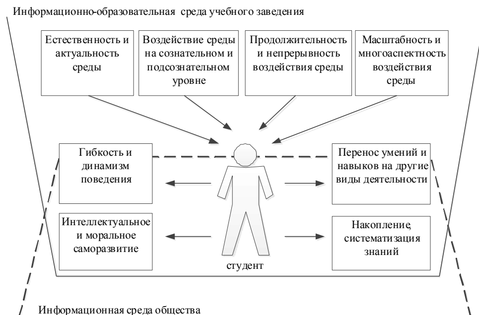
Рис.1. Влияние ИОС на студента

ного знаниевого пространства, в рамках которого могут осуществляться интеллектуальное, моральное и духовное саморазвитие, накопление и систематизация знаний, рефлексия.