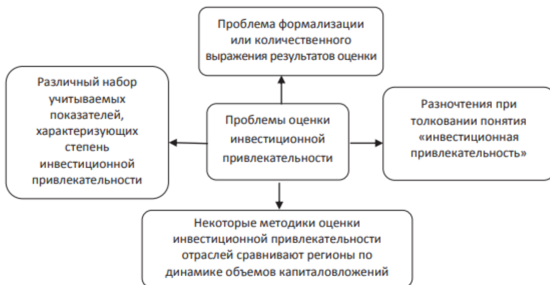
Рис. 1 – Проблемы оценки инвестиционной привлекательности региона Fig. 1 – Problems of assessing the investment attractiveness of the region

На формирование инвестиционного климата оказывают значимое влияние некоторые факторы (рис. 2). Политика государства, действия аппарата управления являются одними из них, но есть факторы, которые фактически неподвластны государству, например географические [5; 6].