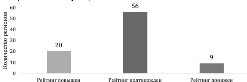
Рис. 3 – Изменение рейтинга регионов в 2019 году по сравнению с 2018 годом

Инвестиционная привлекательность региона определяется с учетом совокупности факторов, влияющих на целесообразность, эффективность и уровень рисков инвестиционных вложений на территории данного региона. Понятие инвестиционной привлекательности региона шире понятия инвестиционного климата и включает не только аспекты регулирования и сопровождения инвестиционной деятельности, но и фундаментальные факторы, характеризующие ресурсный и инфраструктурный потенциал регионов России (рис. 3).