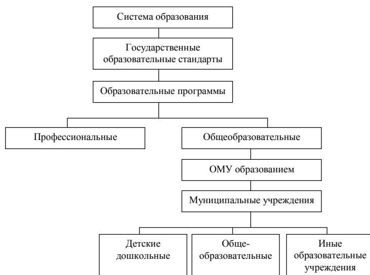
Рис. 1. Структура системы образования на муниципальном уровне

Реализация муниципальной политики в сфере образования и науки в значительной мере определяется уровнем работы соответствующих муниципальных органов, структура которых зависит от «финансовых возможностей муниципального образования, сложившейся системы управления, сети образовательных учреждений, а также наличия необходимых специалистов. На практике органы управления образованием в муниципалитетах могут быть организованы как отдел (комитет, департамент) образования в структуре местной администрации, имеющей статус юридического лица» [2].