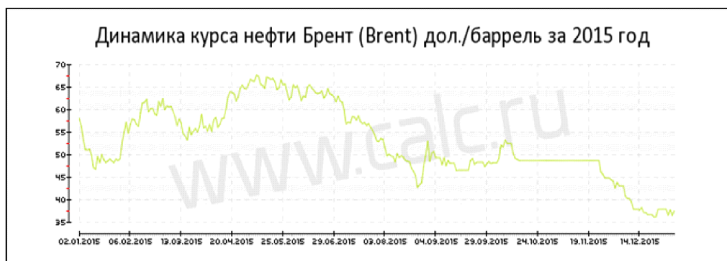
Рис. 1. Динамика курса нефти Brent в 2015 году