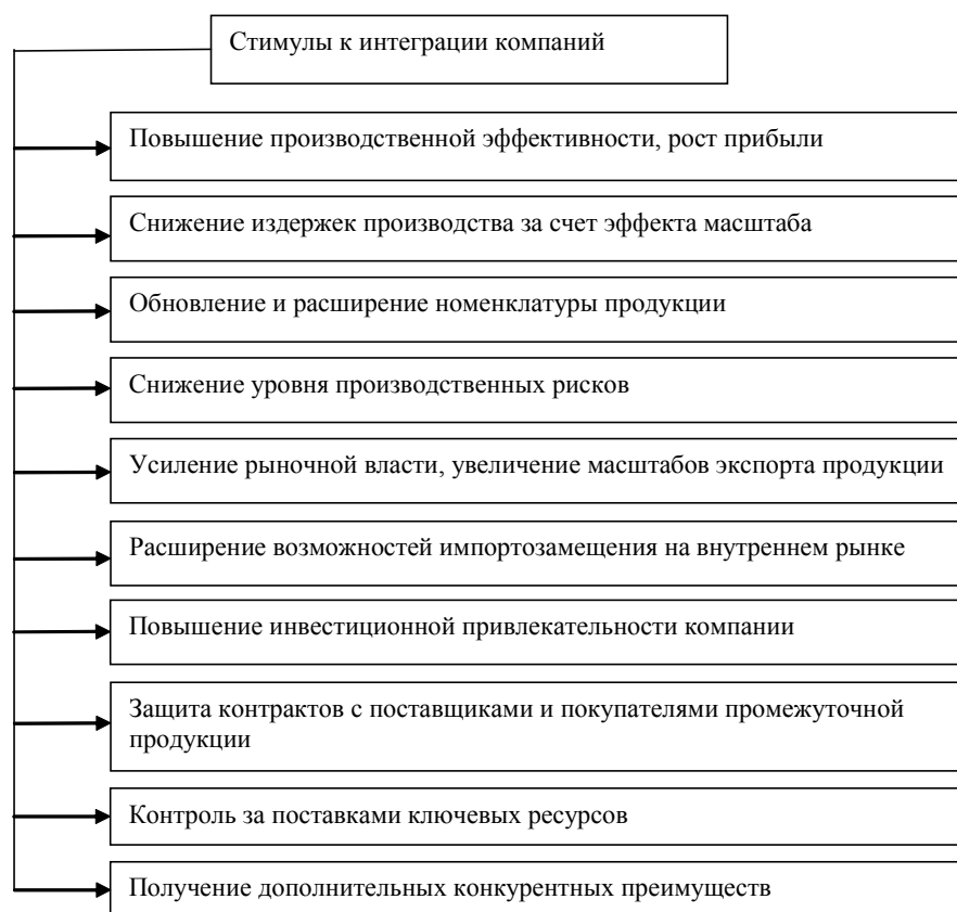
Рисунок 5. Стимулы к интеграции российских компаний

Таким образом, целью создания интегрированных структур является диверсификация производственных возможностей, реализация синергетического эффекта и получение дополнительных конкурентных преимуществ.