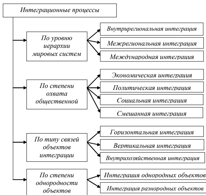
Рисунок 1. Классификация интеграционных процессов

Создание и развитие интегрированных структур способствует росту эффективности экономической деятельности компаний, оптимизации издержек, сокращению производственных потерь, т.е. повышению экономических показателей деятельности предприятий за счет рационального использования имеющихся ресурсов. Нарастивание кооперации внутри объединения происходит на основе интеграции и образовании новых организационных форм хозяйствования, способствующих, в т.ч. и решению социальных проблем региона (рис. 2). [5]