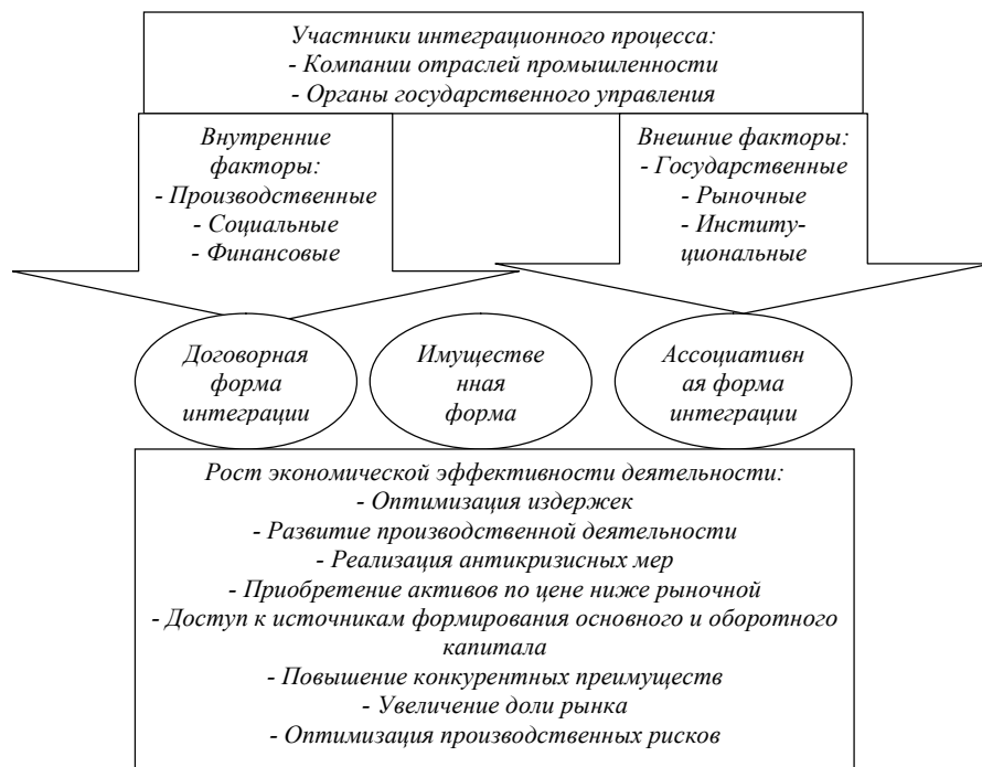
Рисунок 2. Развитие интеграционных процессов

ках использования заемных средств, а также источниках их формирования. В случае, если рыночная конъюнктура неблагоприятна для развития интеграционных процессов, проводится корректировка планов с целью минимизации финансовых рисков.