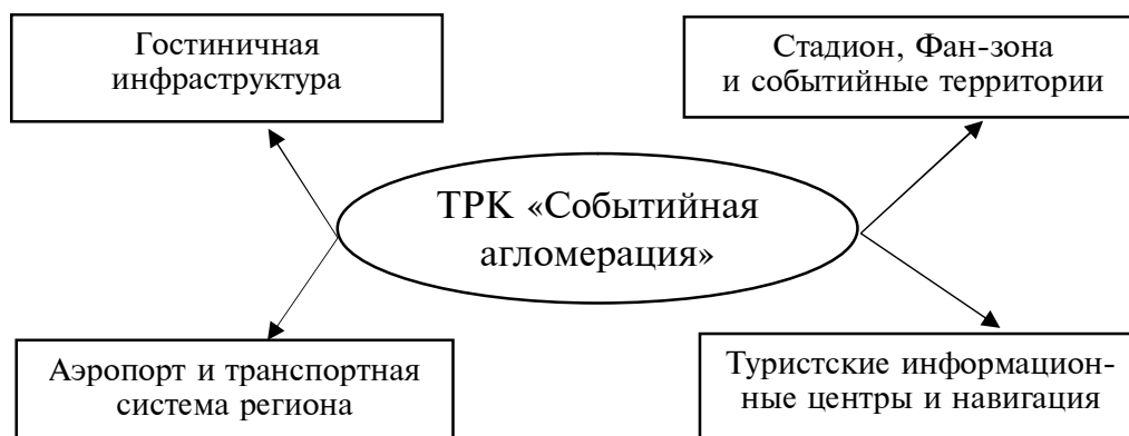
Рис. 3. Направления развития ТРК «Событийная агломерация»

Ниже рассмотрены источники финансирования, где наибольший упор делается на привлечение частных инвестиций (72,2 %), из регионального бюджета планируется выделять 16,33 %, а из федерального бюджета – 11,47 % (таблица 4).