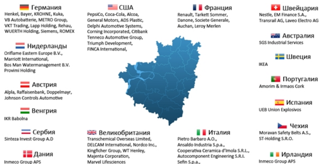
Рис. 2. Иностранные инвесторы Самарской области [4]

Крупнейшими иностранными фирмами, инвестирующими в Самарскую область, являются следующие: