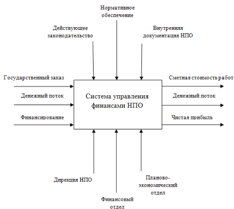
Рис. 2. Функциональная модель системы управления финансами НПО

Функциональная модель системы управления финансами НПО представлена на рис. 2.