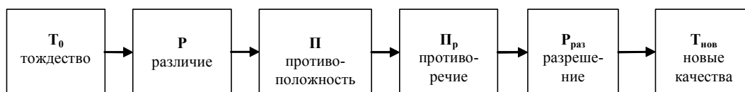
Рис. 1. Логическая схема развития противоречий

Дальнейшее проникновение на элементарный, наиболее общий, сущностный уровень в понимании «развития» связано с принятием диалектической точки зрения на организацию. Диалектический метод предполагает выделение в составе организации противоположных частей. Например, подвижное – неподвижное; временное – пространственное. Эти противоположности соответствуют таким организационным элементам, как процессы и организационная структура, между которыми могут развиваться противоречия. Противоречие является источником самодвижения в природе и обществе [6, с. 1072]. Поэтому необходимо рассмотреть это центральное понятие диалектики, которое выражает сущность закона единства и борьбы противоположностей . Здесь рассматривается диалектическое противоречие, которое «движется и развивается» [3, с. 301]. Поняв процесс развития противоречия, на сущностном уровне будут понятны исследуемые явления – изменение и развитие. На рис. 1 представлена логическая последовательность ступеней развития «противоречия», его развертка во времени.