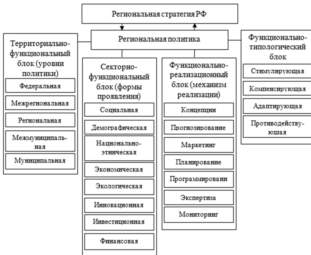
Рисунок 1 – Структурно-функциональные блоки региональной политики Figure 1 – Structural and functional blocks of regional policy

Шарыгин М.Д., Воронина В.В. рассматривают структуру региональной политики в виде блоков (рисунок 1) [7].