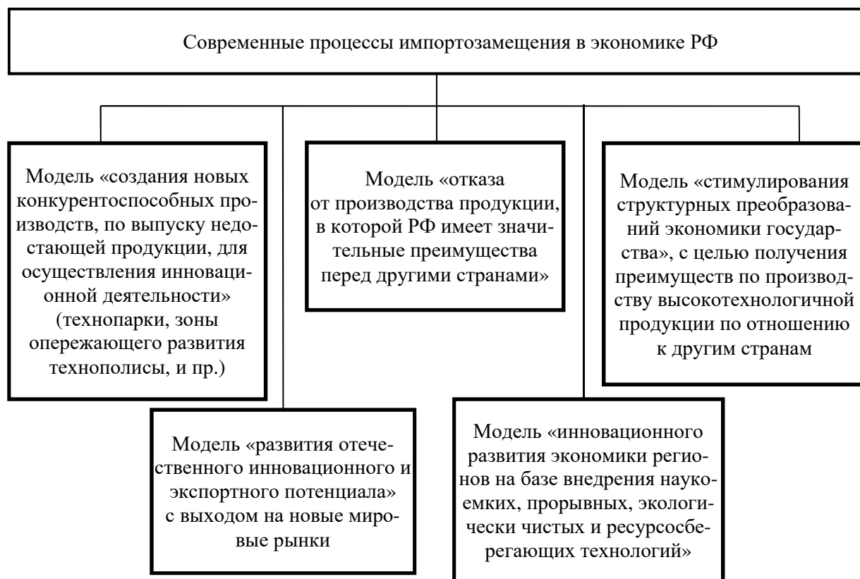
Рисунок 1 – Современные модели импортозамещения в экономике РФ Figure 1 – Modern models of import substitution in the Russian economy

В современных реалиях развития экономики основные модели политики импортозамещения отражены на рисунке 1.