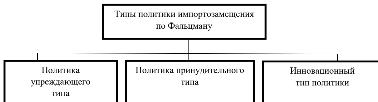
Рисунок 2 – Типы политики импортозамещения по Фальцману [22]

В настоящее время в мире насчитывается несколько типов политики импортозамещения. Политика представляет собой деятельность государства, направленную на поддержку какого-либо явления или, наоборот, противостояния ему. В сфере импортозамещения, государство выполняет ведущую роль, как это было отмечено ранее, протекционизм в отечественном секторе экономики играет основную роль. Исследователь В.К. Фальцман выделяет три типа политики импортозамещения (рисунок 2).